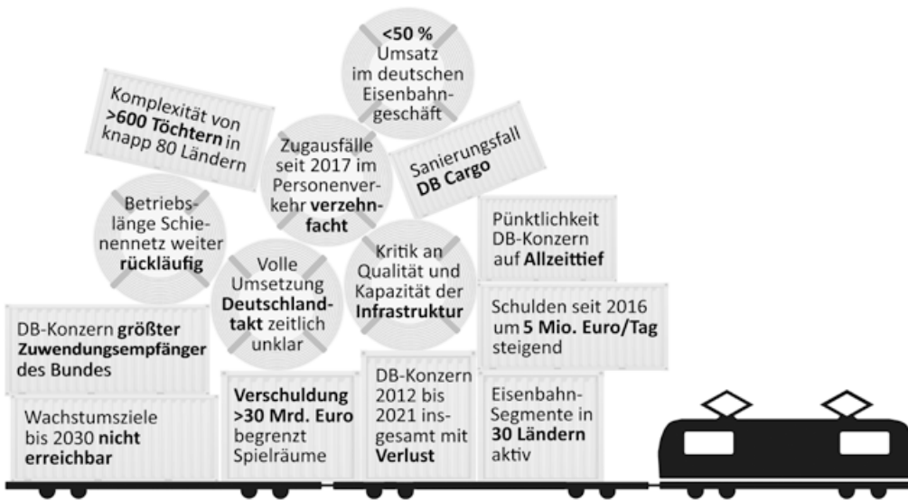
Abb. 5 Grafik zu Problemen der Deutschen Bahn, aus dem Bericht des Bundesrechnungshofs vom 15.3.2023 (nachgebaut)

Marketing-Dimension realisiert sich in Offenbach und Münster in der Bewerbung eines Zukunftsbahnhofs zum Wohlfühlen, der angesichts der gegenwärtigen Strukturprobleme der Deutschen Bahn, so möchte man sagen, nicht zufällig in der Zukunft liegt.