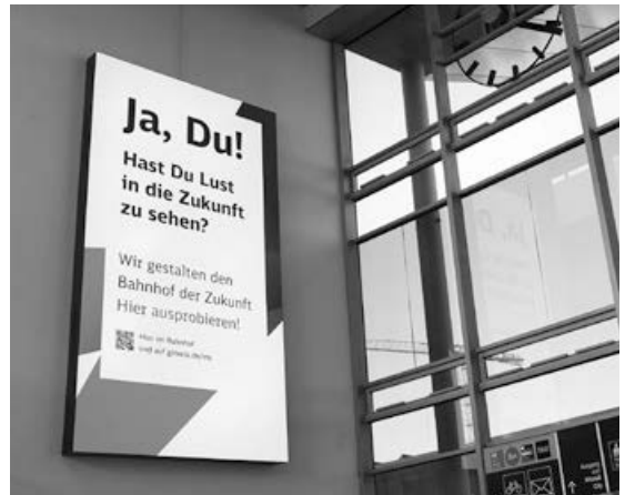
Abb. 4 Anrufung durch DB-Werbebanner, Fotografie Bahnhof Münster, aus Newsmeldung auf GoBeta.de , 24.9.2020

Insgesamt zeigen die Maßnahmen in Offenbach und Münster, dass die Tests ein Instrument der Marktforschung darstellen, das sich im Unterschied zu einer situationsunabhängigen Befragung von Nutzer*innen auf deren Umgang mit konkreten Prototypen bezieht, die in ein real-world setting hineingegeben werden. Die Aufmerksamkeit für atmosphärische Aspekte lässt sich dabei als eine Form der Environmentalisierung 49 verstehen, die Zufriedenheit nicht allein auf funktionaler Ebene verortet, sondern – wie es in der Offenbacher Design-Studie heißt – (auch) emotional zu erreichen sucht. Ganz im Sinne Marshall McLuhans werden Atmosphäre und Umgebung hier also als Medien verstanden, 50 die auf die Subjekte vor Ort einzuwirken vermögen. In dieser «Verschränkung von technologischen und ästhetischen Programmen» öffnet sich der Bahnhof Fragen des Verhaltensdesigns, das durch die Gestaltung von Umgebungen auf Subjekte Einfluss zu nehmen versucht. 51 Dies betrifft allerdings nicht nur das Mobilitätsdesign im engeren Sinne, insofern die indirekte Form der Regierung, die hier durch atmosphärische und umgebungsbezogene Aspekte erreicht werden soll, als Zeichen eines weniger disziplinarischen als vielmehr kontrollorientierten Umgangs mit Regulierung am Bahnhof verstanden werden muss. Dies zeigt sich in der stetigen Stärkung des «Unternehmens-Regime[s]» 52 , für das Gilles Deleuze bündig festgehalten hat: «Marketing heißt jetzt das Instrument der sozialen Kontrolle». 53 Exakt diese