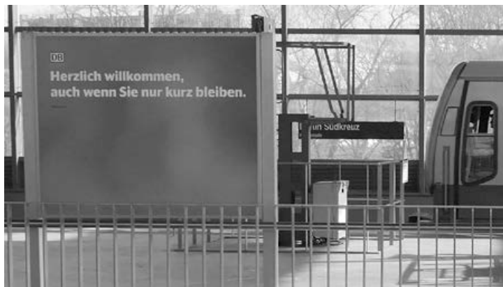
Abb. 2 Willkommen-Kampagne der DB, Berlin Südkeuz, 2022

Für den Betrieb der rund 5.400 bundesdeutschen Bahnhöfe ist seit 1999 die DB Station&Service AG zuständig, ein Tochterunternehmen der Deutschen Bahn. Da Fragen der Kundenzufriedenheit seit den 2010er Jahren auch für Bahnhöfe zunehmend in den Blick rückten und der erwirtschaftete Umsatz maßgeblich von der Zahl der Stationshalte sowie den Einnahmen aus der Vermietung von