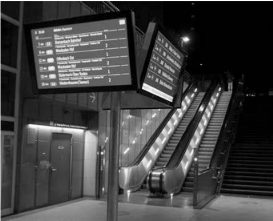
Abb. 3 Foto aus Tweet von project-mo.de, Mobilitätsmonitor, 15.6.2021