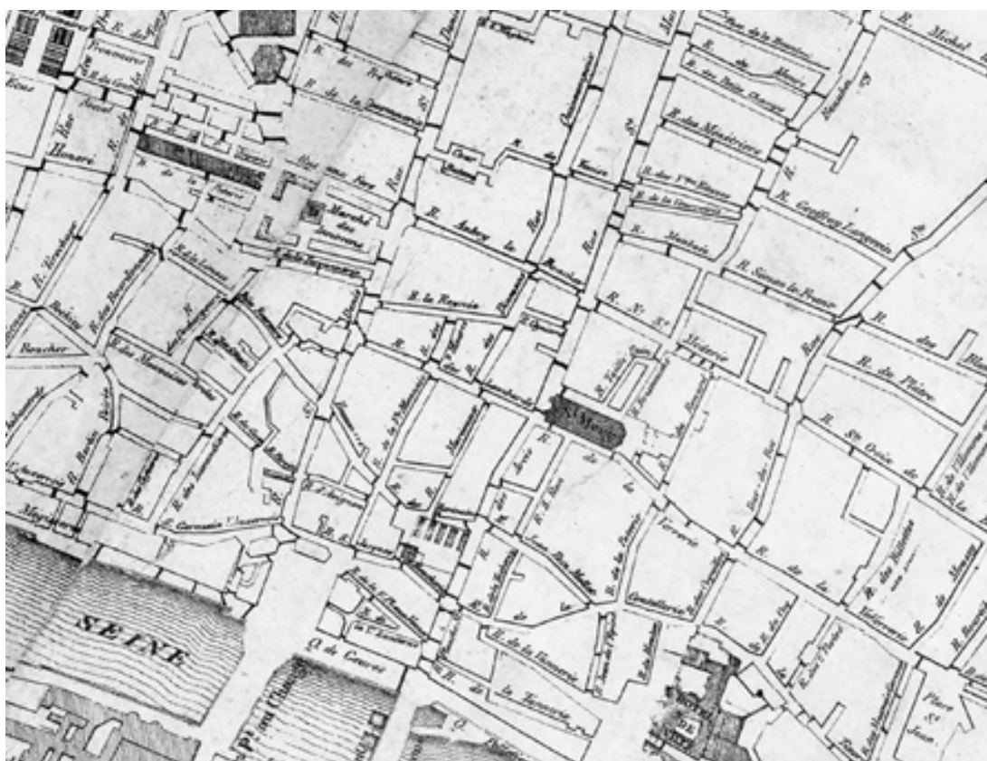
Abb. 2: Barrikadenkarte der Julirevolution 1830 (Ausschnitt). Die Rue St. Martin und die Rue St. Denis verlaufen parallel vom Stadtzentrum nach Nordosten.

Boulevard de Sébastopol, der zur Zeit der Abfassung der Anleitung nunmehr dieses berühmte Viertel durchtrennt, wird explizit in Blanquis Barrikadenplan integriert und zeigt, wie entschlossen der Revolutionär die neuen Bedingungen herauszufordern bereit ist.