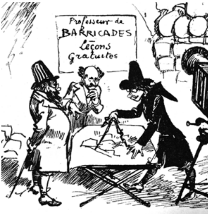
Abb. 1: Albert Robida: Le vingtième siècle (Ausschnitt)

Organisationstechniken, die Netzwerke und Logistik des bewaffneten Aufstandes folgen dabei durchaus einer gewissen Pädagogik des erfahrenen Berufsrevolutionärs. Es handelt sich daher um eine äußerst treffende Anspielung, die der Schriftsteller und Karikaturist Albert Robida in seinem Science-Fiction-Roman Le vingtième siècle (1883) machte (Abb. 1), als er sich einen in schwarz gehüllten »professeur de barricades« vorstellt, der über einem Operationsplan gebeugt »leçons gratuites« erteilt. Welche kulturtechnischen Lektionen hält Blanqui also bereit und was zeichnet seine ungewöhnliche Vermittlungsleistung aus?