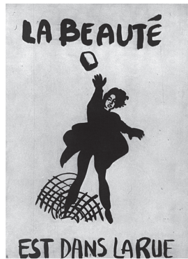
← Abb. 13: Anonym, 3. Mai 1968. Abb. 14: Atelier Populaire, 14. Mai 1968.

beauté est dans la rue« wurde zur Ikone. Die Transformation des fruchtbaren Momentes des Steinwurfs, »optisch-unbewusst« 27 von der Kamera mit sehr kurzer Verschlusszeit eingefangen und kadriert, zu einer ausdrucksstarken Grafik ist sehr aufschlussreich. Was wurde reproduziert und also erhalten? Die Frauenfigur, ihre Wurfgeste, der fliegende Stein und zwei Baumgitter. Es verschwinden die Nebenfiguren, der Asphalt, der Rauch der Tränengasgranaten und die von Bäumen eingefasste Menschenmenge. Für eine gesteigerte Expression sind die verbliebenen Elemente stilisiert, was eine sehr wirkungsvolle Reduktion darstellt. 28