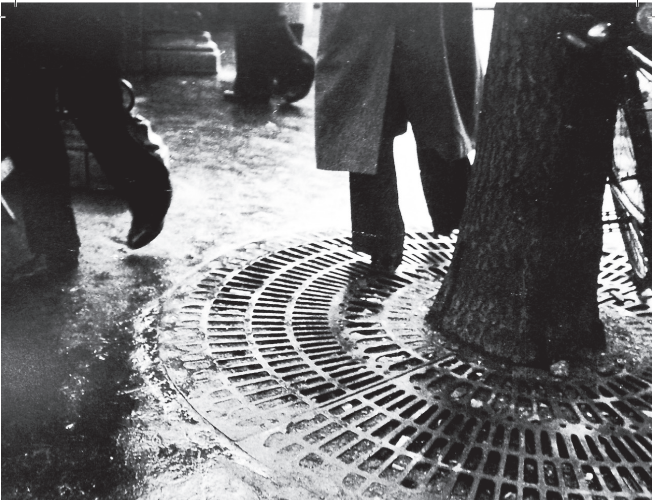
↑ Abb. 1: Wols, ohne Titel, Paris, um 1936.