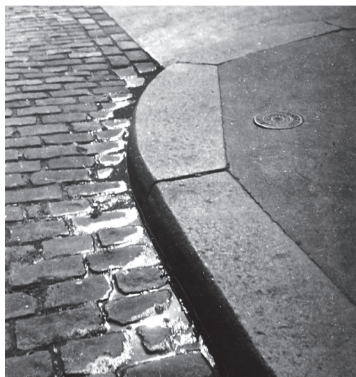
← Abb. 2+3: Wols, ohne Titel, Paris, um 1936.