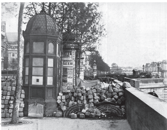
Abb. 10: Anonym, Barrikade am Boulevard Puebla am 18. März 1871.