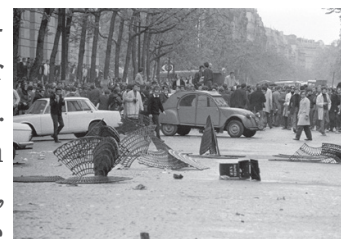
↑ Abb. 12: Bruno Barbey, Boulevard Saint-Germain am 6. Mai 1968.

Im zweiten Bild transportieren einige Männer unter großer Mühe die schweren Gitter an den rechten Ort, während hinter ihnen andere Männer Autos querstellen, ebenfalls fotografieren oder schlicht dem Spektakel zusehen. Die beiden Gitterträger sind avantgarde im buchstäblichen Sinne des Wortes, insofern sie sich in Richtung der Ordnungskräfte vorwagen, um etwas herzustellen, das noch flüchtiger als ein gehäufter Pflastersteinberg daherkommt. Die zweite Fotografie dokumentiert die filigran arrangierten Baumgitter in der bekannten, aber nunmehr autonomen oder vielmehr selbstabhängigen Ordnung. Aufrecht und sich selbst tragend geben sie dem Protestbekunden eine bizarre Visualität und stehen ganz im Kontrast zu verqueren Automobilen oder hastigen Steinhäufen in den kleineren Nebenstraßen des Viertels. Die Pressefotografen dokumentieren diese äußerst vergängliche Barrikade aus Sicht der Polizisten. Einige Gitter sind bereits zu Boden gefallen und verharren wiederum in ihrer kläglich-banalen Horizontale. Es ist der schmale Grat der visuellen Dialektik des Baumgitters im Pariser Mai 1968.