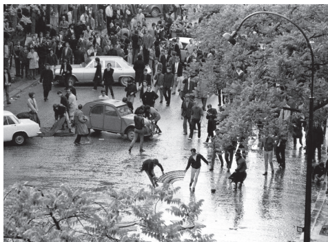
← Abb. 11: Bruno Barbey, Boulevard Saint-Germain am 6. Mai 1968.

Das Pariser Baumgitter feiert sein performatives und visuelles Nachleben während der Proteste im Mai 1968. Neben den bekannten Fotografien von Barrikaden aus Pflastersteinen, welche die populäre Ikonizität dieses Ereignisses maßgeblich bestimmen, finden sich auch andere, überraschendere Bilder. Vereinzelt trennen Protestierende Baumgitter von ihren Bäumen und lassen ihnen neue Funktionen zukommen. Auf dem Boulevard Saint-Germain im Quartier Latin, dem zentralen Ort der Auseinandersetzungen zwischen Polizei und Protestmenge, entsteht eine Baumgitter-Barrikade. In ihr schlägt die eigenwillige Ornamentalität des Gitters vollends durch und verabschiedet sich von ihrer dekorativen Assistentenrolle des vergangenen Jahrhunderts.