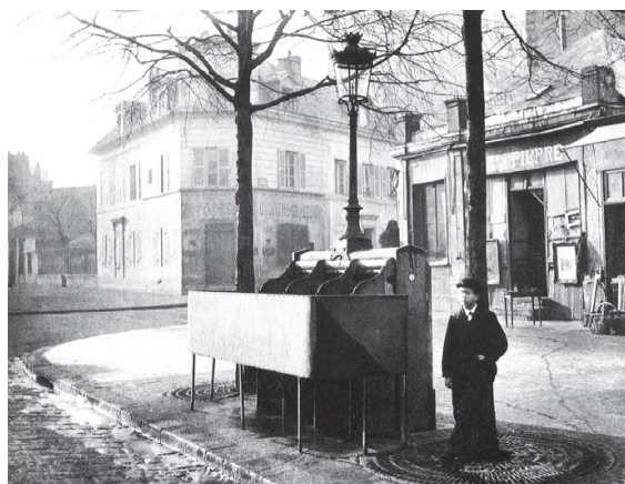
← Abb. 5: Charles Marville, Réverbère, Boulevard du Sébastopol. Abb. 6: Charles Marville, Vespasienne, Chaussée du Maine.